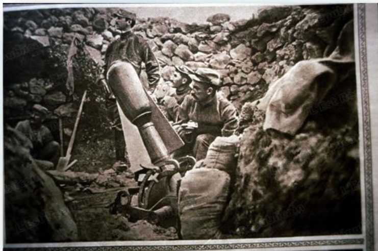
TORPILLES DE TRANCHÉES