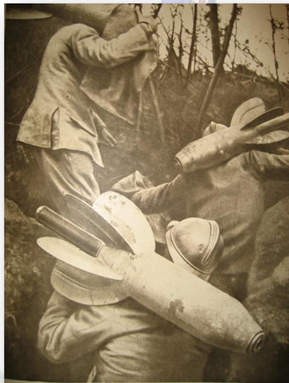
TRANSPORT D'OBUS DE CRAPOUILLOTS