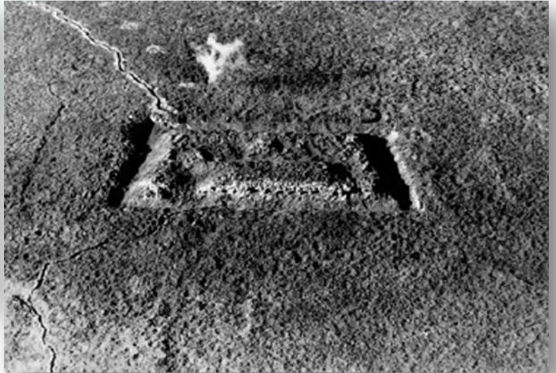
FORT DE VAUX 1917

Le Fort de VAUX, contre lequel les Allemands s'acharnèrent ; il fut pris par eux le 8 Juin 1916, après sept jours et sept nuits de défense héroïque ; cinq mois plus tard nous le reprenions définitivement. The Fort of VAUX, which was furiously attacked by the Germans ; taken by the 8 th of June 1916, after seven days and nights of heroic defence ; retaken by us définitively five mouths later.