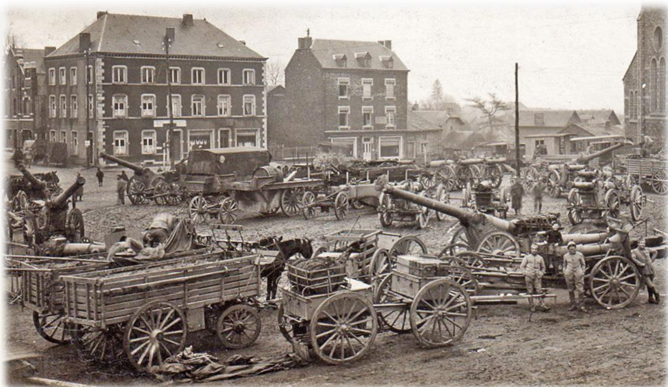
144. La Grande Guerre 1914-15 Sur le front - Mise en batterie d'un canon de 75 A. R.