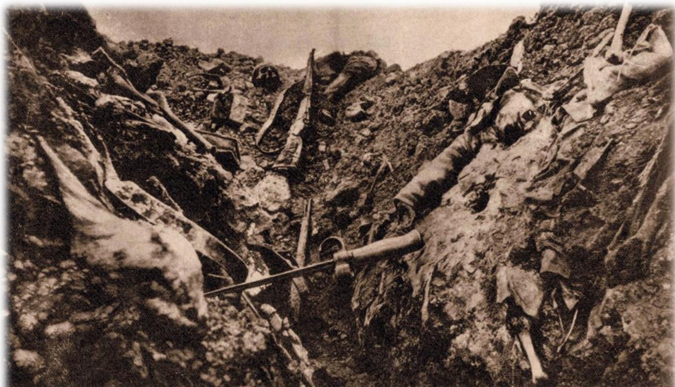
AUX ÉPARGES, UNE TRANCHÉE CREUSÉE DANS DES DÉBRIS HUMAINS.