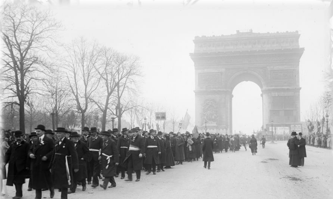
Délégation des maires défilants à l'Arc de Triomphe.

En septembre, l'État-Major allemand fait savoir à l'empereur que la guerre est perdue, mais ni Guillaume II, ni les chefs militaires ne veulent assumer la responsabilité de la défaite.