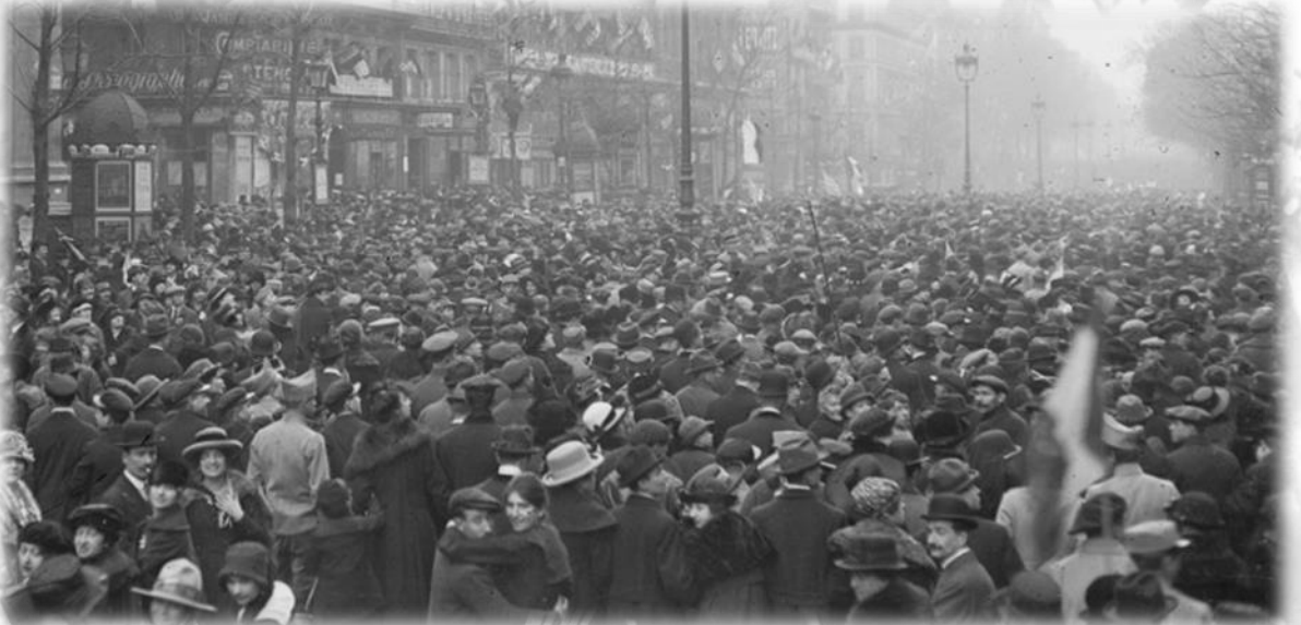
Les grands boulevards le jour de l'armistice 1918.

Malgré la défaite, celle-ci est également célébrée à Berlin par la population allemande, pour qui elle signifie la fin des souffrances.