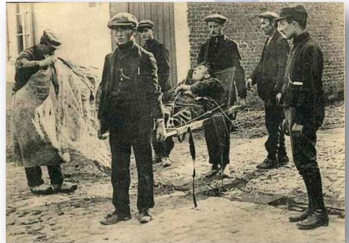
TRANSPORT DE BLESSÉS