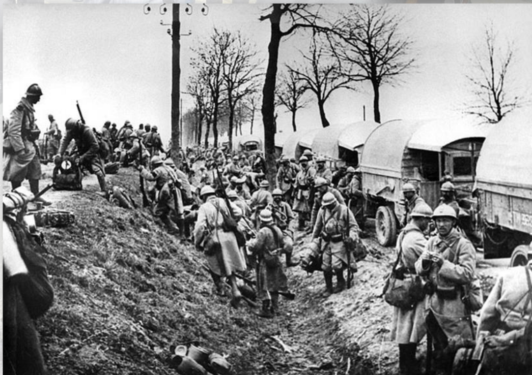
« C'EST UN EMBOUTEILLAGE INDESCRITIBLE »