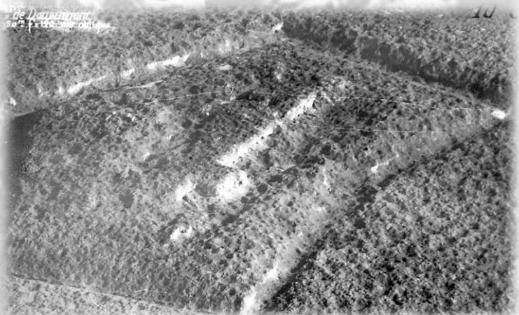
Douaumont, le fort après les bombardements