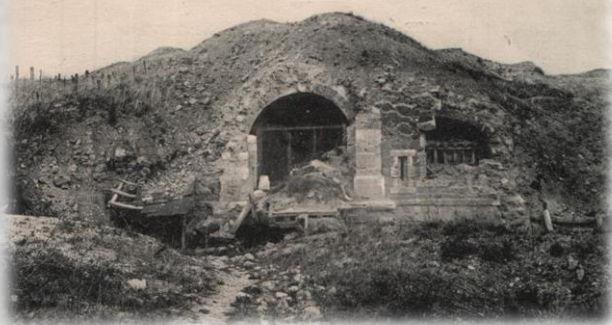
Le Fort de SOUVILLE, que les Allemands ne purent prendre malgré de furieuses attaques; le 12 juillet 1916, 150 Allemands qui avaient pris pied sur le sommet du fort furent tués ou faits prisonniers. - Souville restait inviolé. The Fort of SOUVILLE, extrem limit of the german advance.