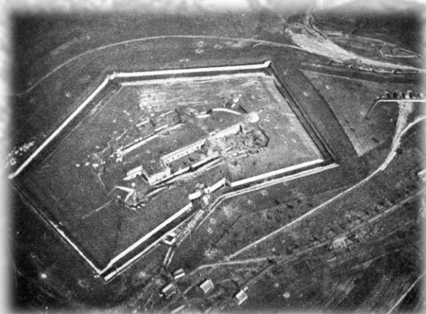
Douaumont, vue aérienne du fort avant 1916

La tentative reprise du fort de Douaumont s'est soldée par un échec cuisant avec de lourdes pertes.