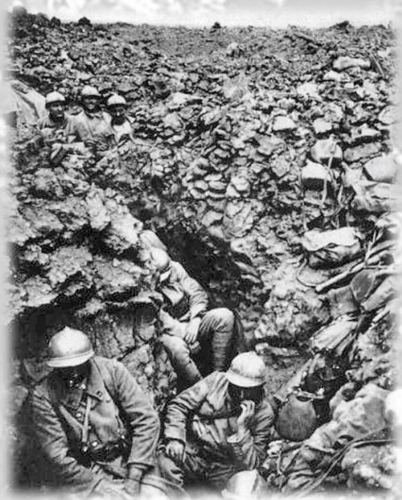
Soldats français sur la cote 304.

Pour la nation tout entière, Verdun devient le symbole du courage et de l'abnégation.