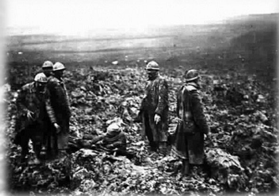
Après la bataille de Verdun - brancardiers ramassant les blessés.